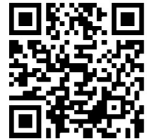
Signature of Director

www.saaracertification.com & www.uafaccreditation.org